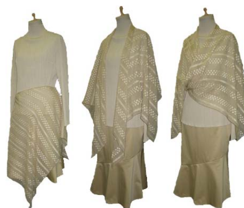
図10 スカーフの着用方法