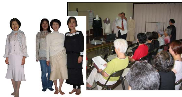
図11 試着アンケート

試作した衣料について、おしゃれに関心の高い中高齢者10名に試着をして頂くとともに、商品化に向けて改良を加えるためのアンケート調査を行った。調査内容は、年代、既製服のサイズ、好みの素材、ゆとりサイズ、着心地、購入先、価格等であり、平成17年9月5日に小松市三日市商店街「おけいこ座」において調査を実施した。