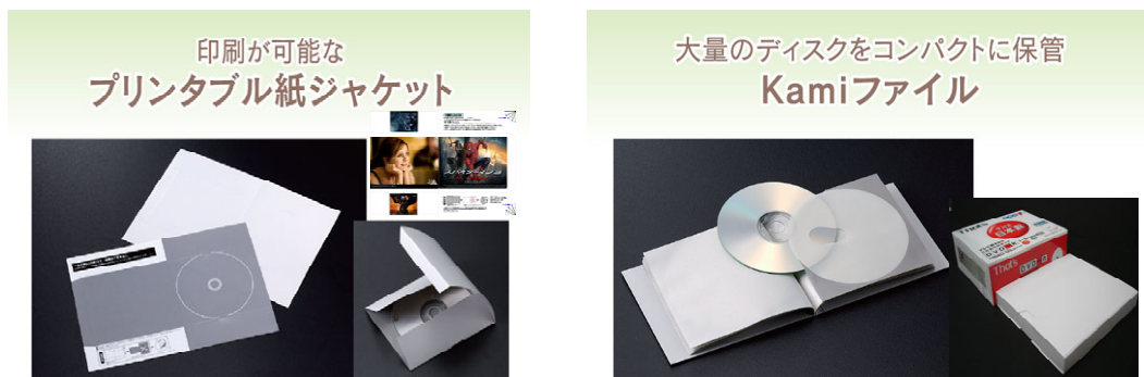
図2 豊富な製品バリエーション

オール紙製で、高価な金型費用がかからないので製品のバリエーションを創造することができます。図2に製品の一例を示します。