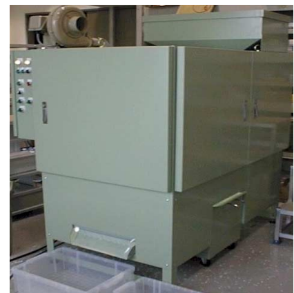
図2 ペレット選別装置の外観