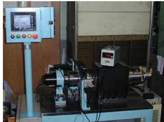
図2 試作チャックシステム全体の外観