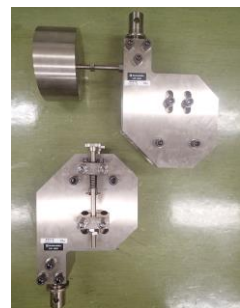
手動式キャブ スタン型 (ロープ)