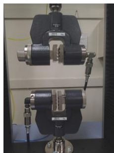
油圧式平面型 (織編物)