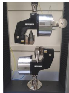
空気式キャブ スタン型 (糸)